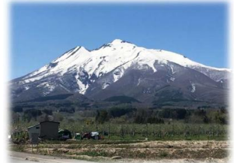
岩木山(弘前葛原から 2025年5月撮影)

※『津軽世去れ節』（1972年著）。『津軽じょんから節』（1973年）と合わせて直木賞を受賞。津軽出身者である（長部日出雄）だからこそ書けた作品との評。