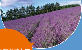
具有许多充满魅力的 观光景点与美食