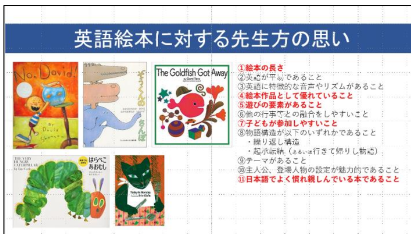
資料2：学生の指導案作成にかかわる PowerPoint の説明資料