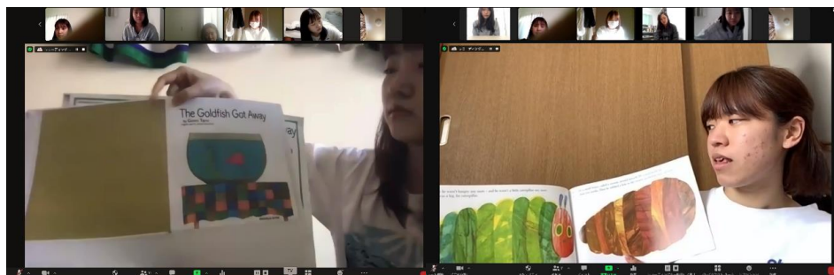
資料3；遠隔授業における英語絵本の読み聞かせの際の模擬保育の様子